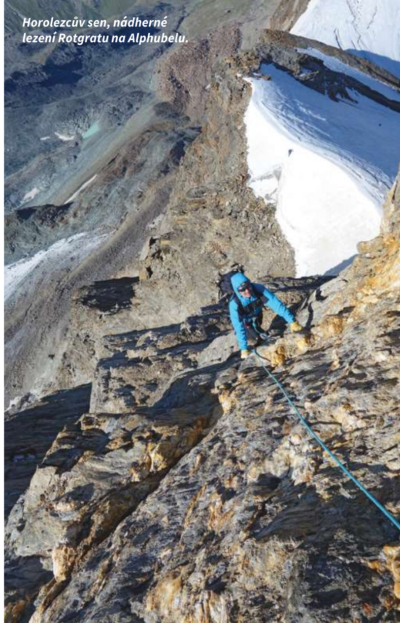
Horolezcův sen, nádherné lezení Rotgratu na Alphubelu.

Budíček v jednu. Polák, co spal pod stolem v kuchyňce, se nerudně zavrtěl, když jsem na něho nechtíc ve tmě šlápl. Čaj a kaše. Amaroun vůbec do těla nechce, ale s prázdným žaludkem to nejde. Něco v něm musí být. Hlavní chod dnešního dne je před námi. Bude to pořádná porce. Společně s dvěma místními guidíkama se na to jdeme podívat, slézáme po žebříku na ledovec a začínáme šněrovat po celkem dobře