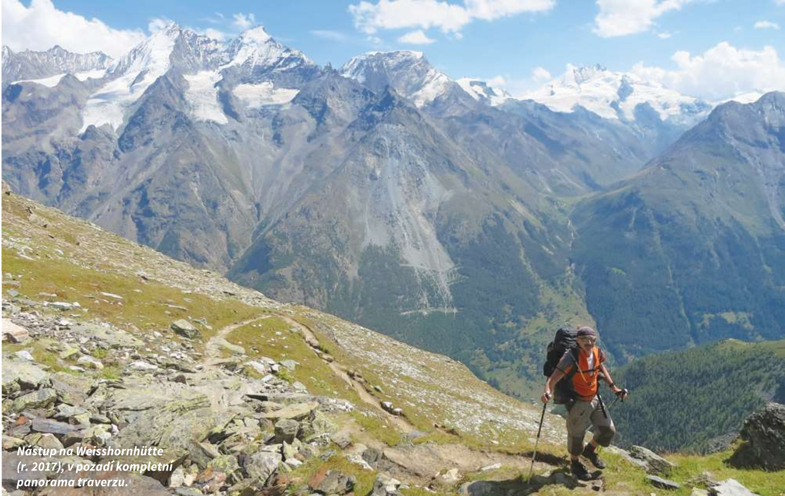
Nástup na Weisshornhütte (r. 2017), v pozadí kompletní panorama traverzu.