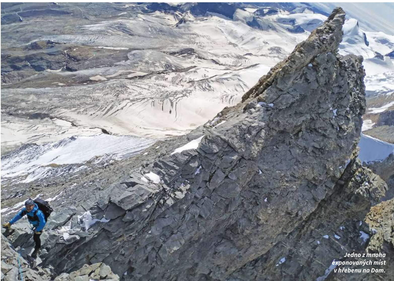
Jedno z mnoha exponovaných míst v hřebenu na Dom.